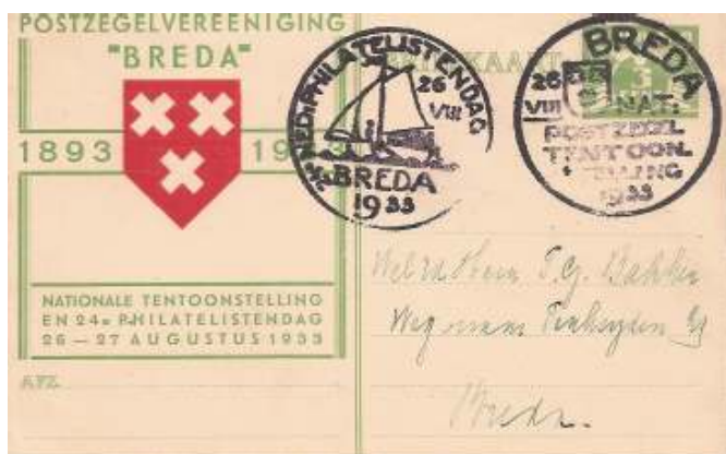
Afbeelding 1 Briefkaart met ingedrukte postzegel van 3 cent (lokaal port) uitgegeven door de Postzegelvereniging Breda vanwege hun 40-jarig jubileum.