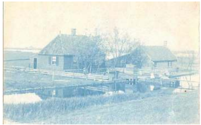
Afbeelding 3 en 3a

2 ½ cent briefkaart bedoeld voor binnenlands gebruik en op de achterzijde voorzien van een afbeelding van een boerderij aan een poldervaart. In de catalogus werd deze briefkaart aanvankelijk opgenomen en later verwijderd omdat deze door de samenstellers nooit was gezien. Welnu de kaart bestaat echt!